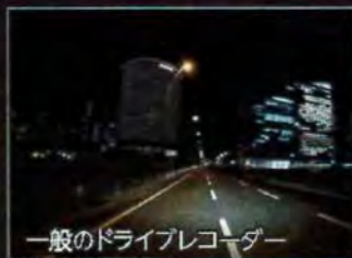
一般のドライブレコーダー

HDR技術で、逆光やトンネル、街灯など明暗差の大きな状況の撮影でも白とびや黒つぶれを抑え映像をきれいに見やすく補正します。