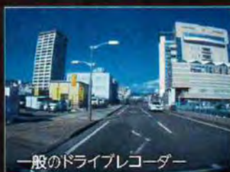
一般のドライブレコーダー

超小型のコンパクトボディに、超広角156°レンズを採用。広い視野の映像を撮影できます。